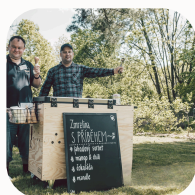
Kavárna pod stanem, Mental Café