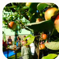
Zahrada pro duši, Denní stacionář Žebřík