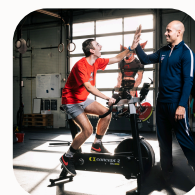
Srdce na pravém místě, Colliery srdcem