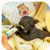
Intenzivní jednotka péče, Záchraná stanice Bartošovice