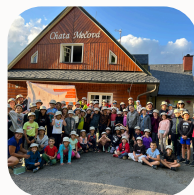
Tábor pro všechny, Šípáček Ostrava