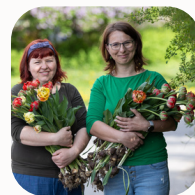
Kde roste radost, spolek Kapradí