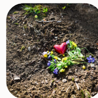
Srdce přírodního hřbitova, Na druhý břeh