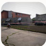
Adelante svět, Armáda spásy v České republice